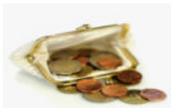
de begroting 2011

De begrotingen 2011 stonden op het programma en de VVD heeft met velen achter de schermen gewerkt aan moties, amen-